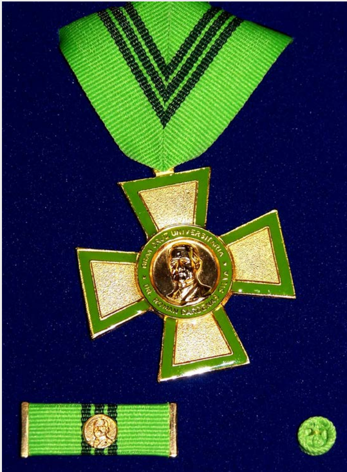
Orden Gran Cruz Universitaria "Dr. Román Cárdenas Silva"