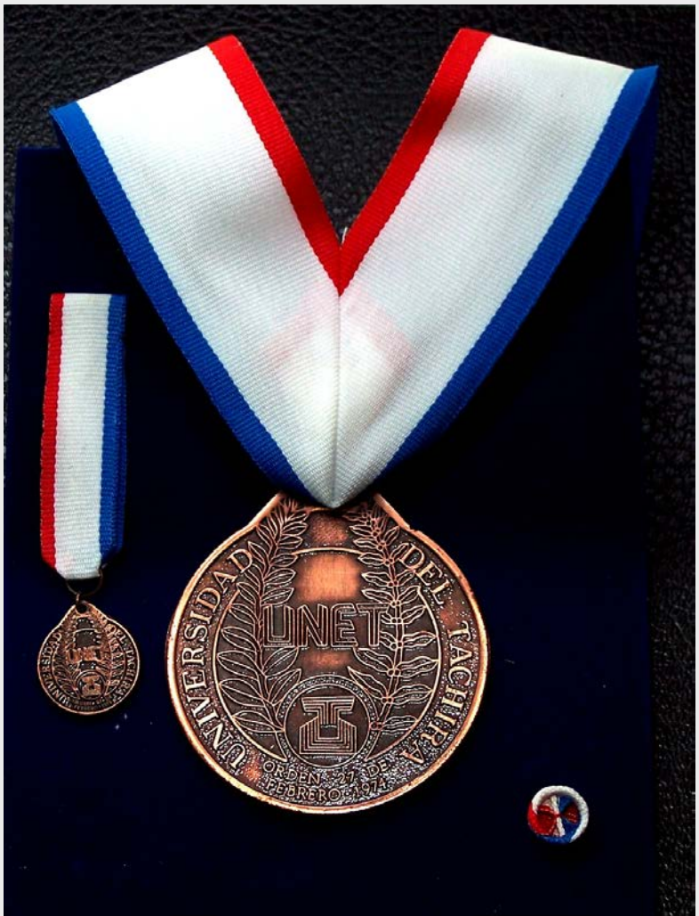
Orden 27 de Febrero. Tercera Clase