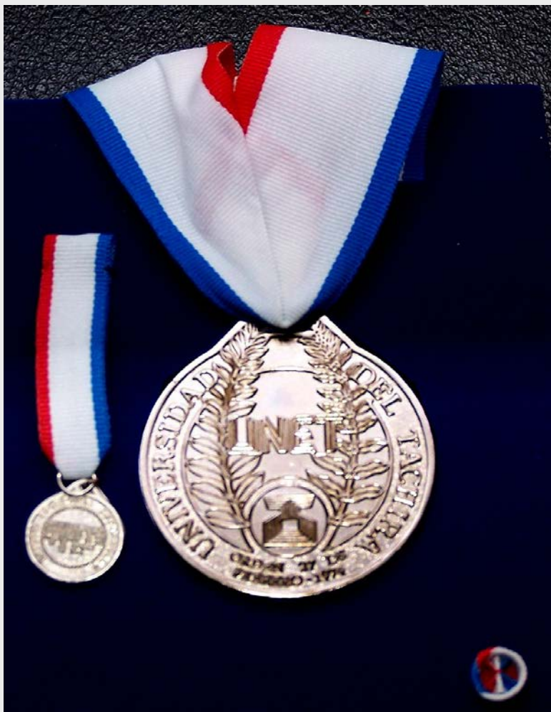
Orden 27 de Febrero. Segunda Clase