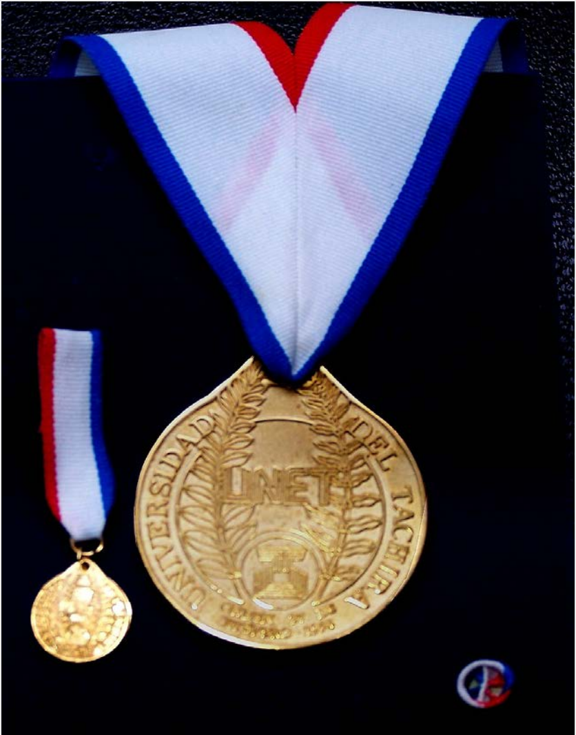
Orden 27 de Febrero. Primera Clase