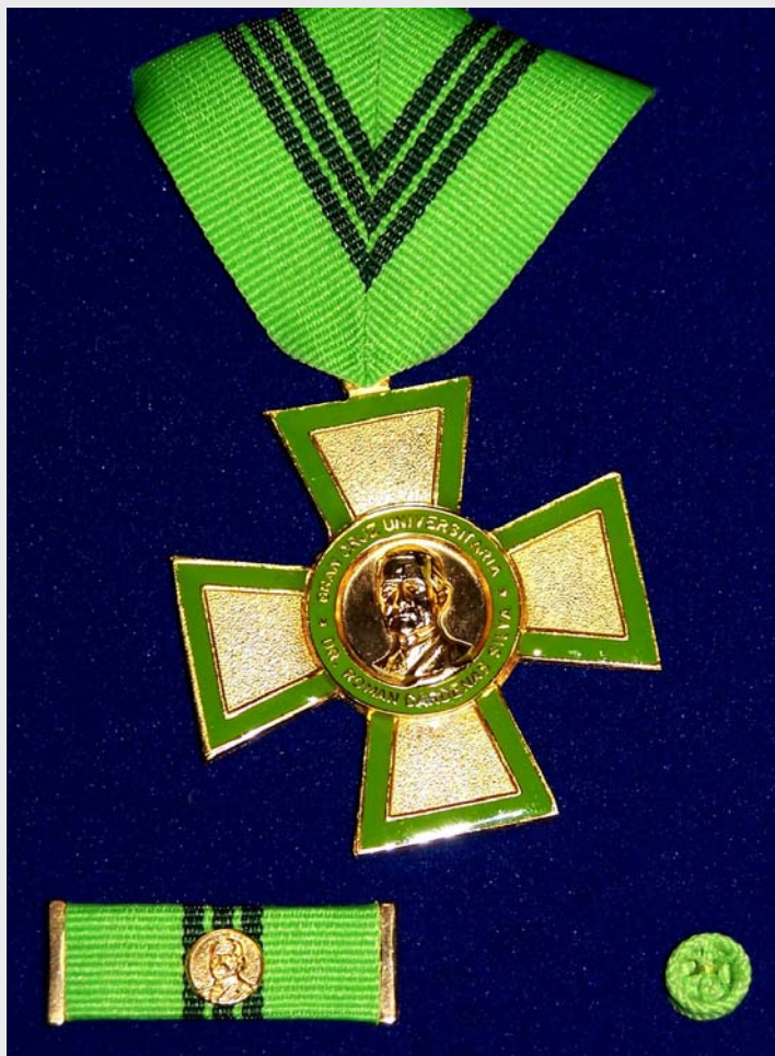
Gran Cruz Universitaria “Dr. Román Cárdenas Silva” Primera Clase

En el año de 1977, obtuvo el título de Administrador Comercial en la Universidad Católica del Táchira. En el año de 1981, obtuvo el título de Contador Público en la Universidad Católica del Táchira. Durante su trayectoria en la Universidad Nacional Experimental del Táchira, desempeñó cargos de Tesorera, Contador, Asesora en la Dirección de Recursos Humanos, entre otros. Realizó trabajos de auditoría en la Lotería del Táchira, Briceño & Del Olmo; Comisaría de Expresos Occidente. Ha obtenido condecoración por 25 años de servicio en el Colegio de Contadores Públicos.