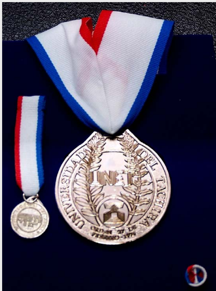
Orden 27 de Febrero. Segunda Clase