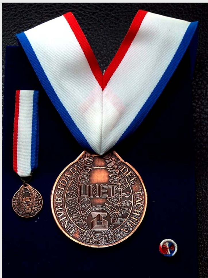
Orden 27 de Febrero. Tercera Clase