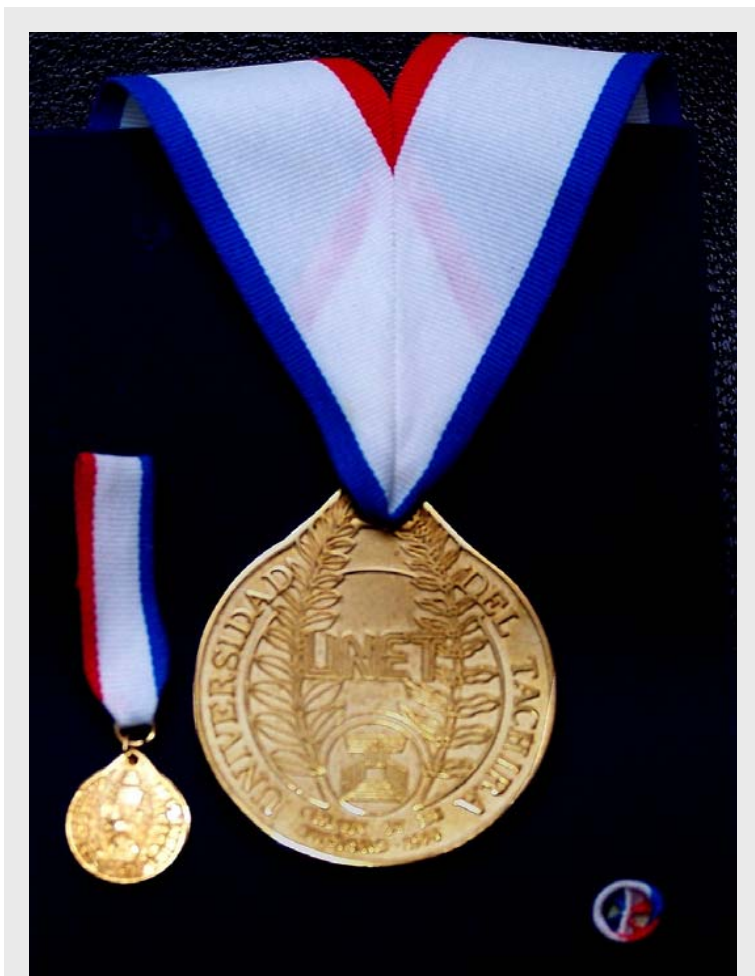
Orden 27 de Febrero. Primera Clase

En el año 1984, obtiene el título de Ingeniero Industrial en la Universidad Nacional Experimental del Táchira. En el año de 1998, obtiene la Maestría en Gerencia de Empresas, mención Finanzas, en la Universidad Nacional Experimental del Táchira. En el año 2004, obtiene PhD. en Ingeniería Industrial y Sistemas de Gerencia en Ingeniería, en la Universidad de Nebraska , en Lincoln , USA. Docente de la UNET, 1993 a la fecha, y Jefe del Departamento de Ingeniería Industrial. Ponente en congresos científicos nacionales e internacionales en el área. Ha publicado artículos en revistas especializadas tales como " Attitude Toward Teamwork and Effective Teaming ", de The Team Performance Management Journal , 2004. Responsable del trabajo de investigación "Procesos grupales en el desarrollo de las organizaciones UNET", 2006. Reconocimiento en el Programa de Promoción al Investigador, Nivel I, 2005 y Premio Estímulo al Investigador UNET, 2006.