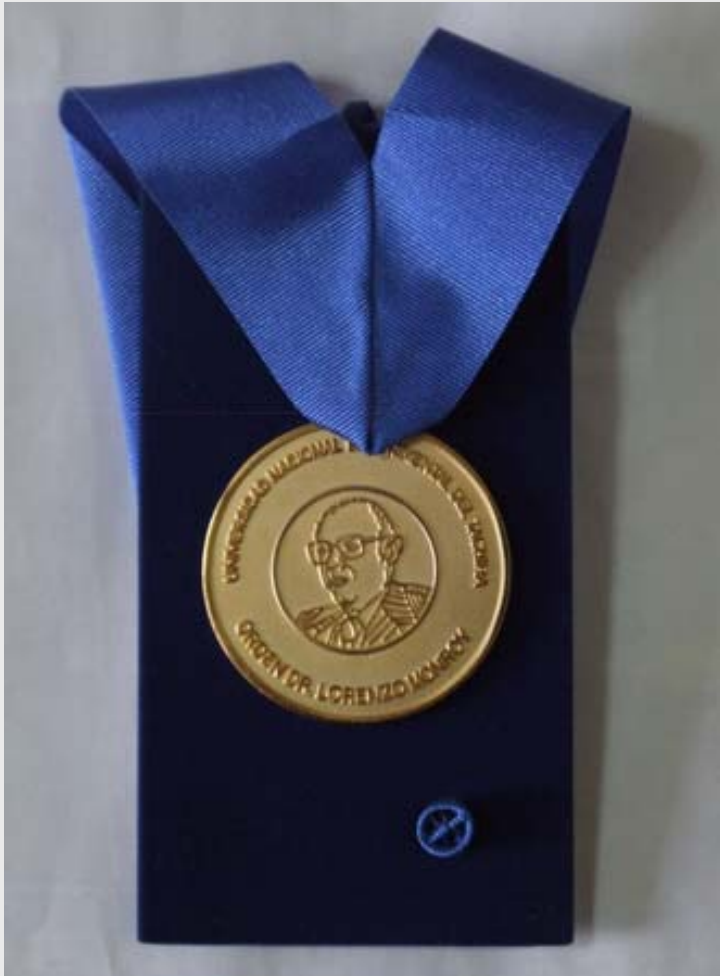
Orden “Dr. Lorenzo Monroy”