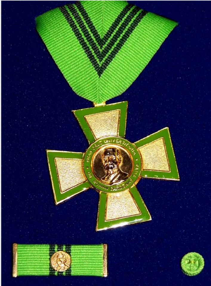
Orden Gran Cruz Universitaria "Dr. Román Cárdenas Silva"