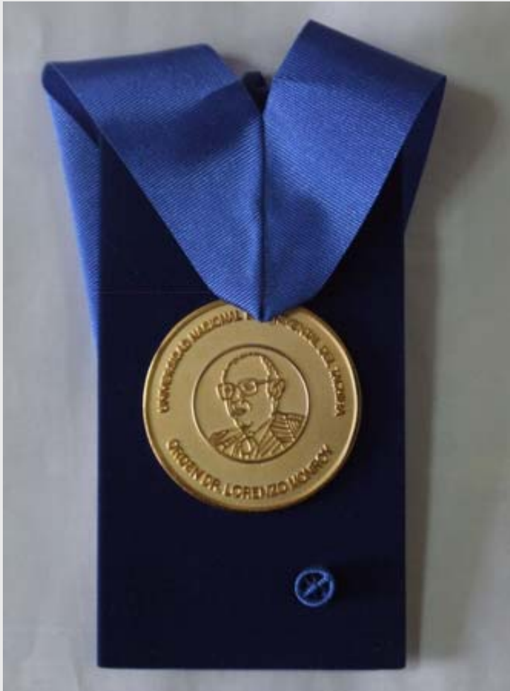
Orden "Dr. Lorenzo Monroy"